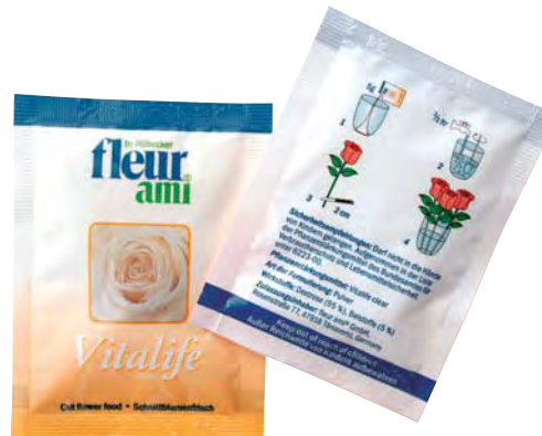
5 g (0.5 liter)