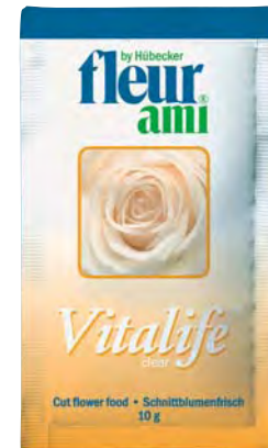
10 g (1.0 liter)