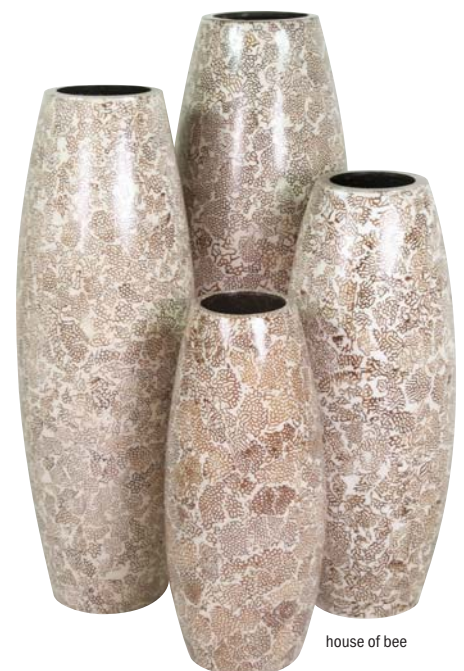
house of bee